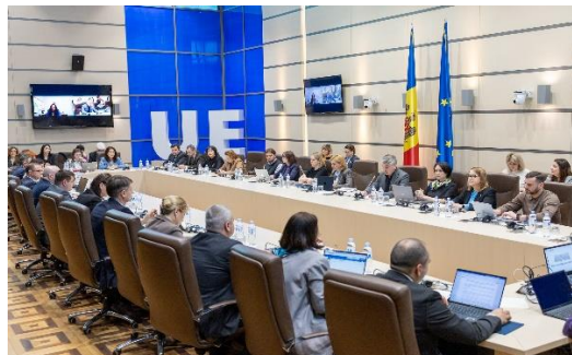
Audieri parlamentare cu privire la situația poluării râului Nistru și impactul asupra mediului și sănătății populației.