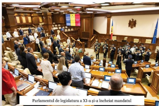
Parlamentul de legislatură a XI-a și-a încheiat mandatul