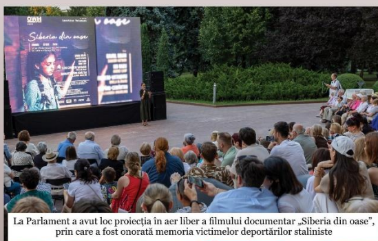
La Parlament a avut loc proiecția în aer liber a filmului documentar „Siberia din oase”, prin care a fost onorată memoria victimelor deportărilor staliniste