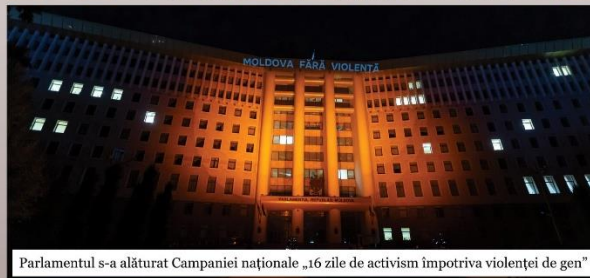
Parlamentul s-a alăturat Campaniei naționale „16 zile de activism împotriva violenței de gen”