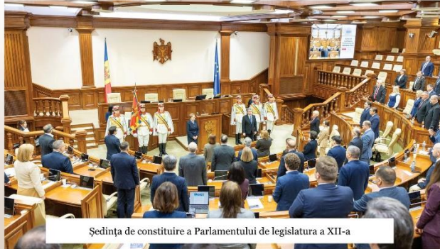
Ședința de constituire a Parlamentului de legislatura a XII-a