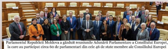
Parlamentul Republicii Moldova a găzduit reuniunile Adunării Parlamentare a Consiliului European, la care au participat circa 60 de parlamentari din cele 46 de state membre ale Consiliului European