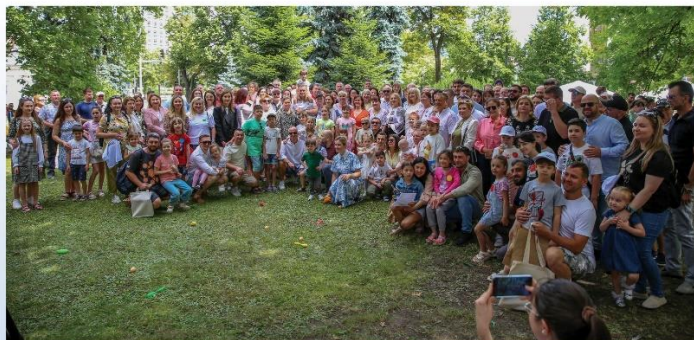
Ziua Națională a Taților