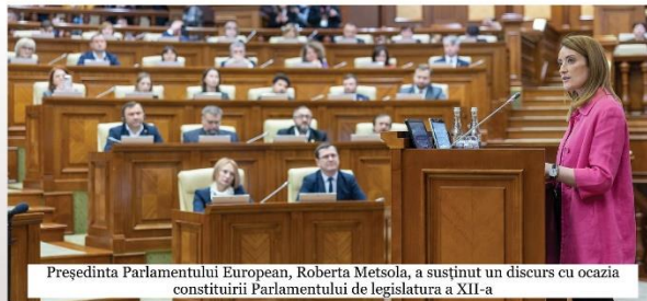
Președinta Parlamentului European, Roberta Metsola, a susținut un discurs cu ocazia constituirii Parlamentului de legislatura a XII-a