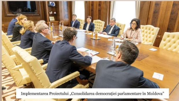
Implementarea Proiectului „Consolidarea democrației parlamentare în Moldova”